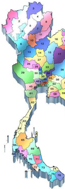
จังหวัดอุบลราชธานี UBON RATCHATHANI